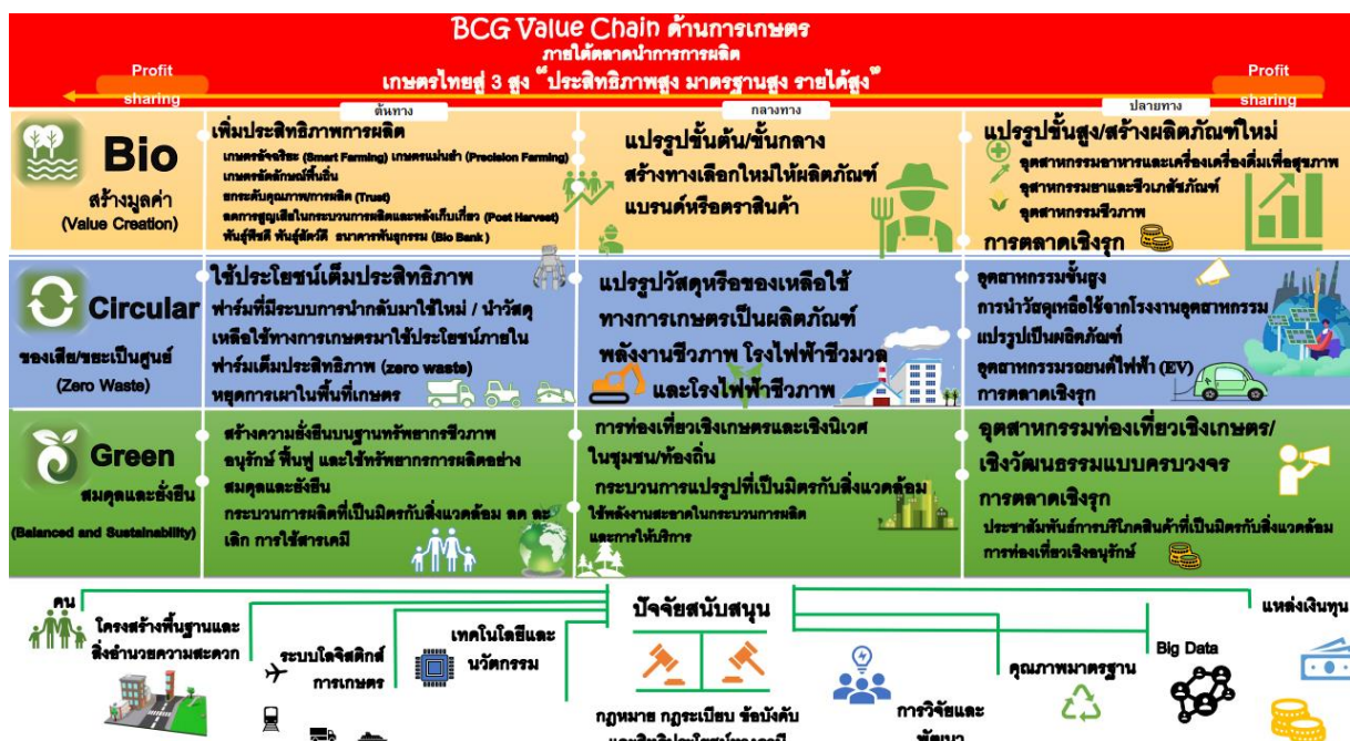
ภาพที่ 2 โซ่คุณค่า (Value chain) ของ BCG Model ด้านการเกษตร

โดยมีปัจจัยสนับสนุนเศรษฐกิจในแต่ละด้าน ได้แก่ คน โครงสร้างพื้นฐานและสิ่งอำนวยความสะดวก ระบบโลจิสติกส์การเกษตร เทคโนโลยีและนวัตกรรม กฎหมาย ภาวะระเบียบ ข้อบังคับ และสิทธิประโยชน์ทางภาษี การวิจัยและพัฒนา คุณภาพและมาตรฐาน Big Data และแหล่งเงินทุน