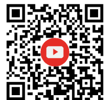
วีดิทัศน์การขับเคลื่อนภาคเกษตร ด้วยโมเดลเศรษฐกิจ BCG

นอกจากนี้ กระทรวงเกษตรและสหกรณ์ยังได้จัดทำแผนการสร้างการรับรู้และประชาสัมพันธ์เกี่ยวกับการขับเคลื่อนการพัฒนาภาคเกษตรด้วยโมเดลเศรษฐกิจ BCG ในรูปแบบวีดิทัศน์ โดยมีการเผยแพร่ในช่องทางออนไลน์ต่าง ๆ อาทิ เว็บไซต์ของหน่วยงานในสังกัดกระทรวงเกษตรและสหกรณ์ Facebook และ Youtube เพื่อสร้างความรู้ความเข้าใจให้กับเจ้าหน้าที่ เกษตรกร รวมถึงประชาชนทั่วไปมากยิ่งขึ้น